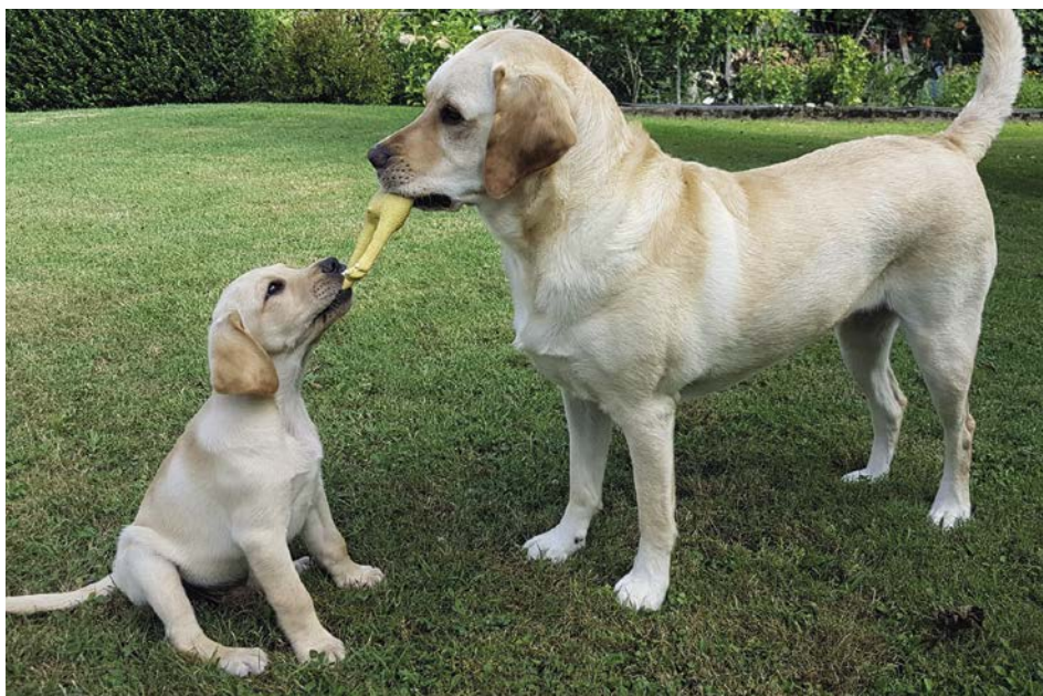
Dino des Hauts Tierdoz avec Dunia des Hauts-Tierdoz