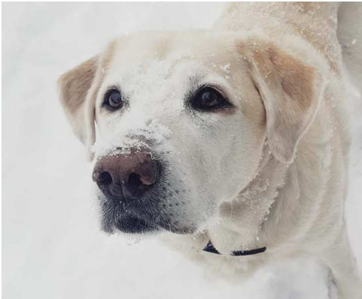
En souvenir de Pala des Hauts-Tierdoz 6.12.2006 – 20.08.2020