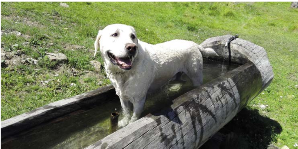
Anakin se rafraîchit lors d'une promenade en montagne